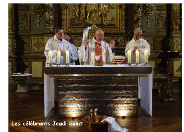
Les célébrants Jeudi Saint