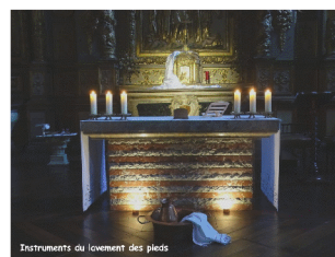
Instruments du lavement des pieds