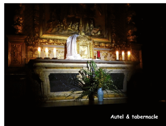
Autel & tabernacle