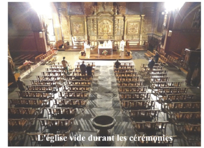
L'église vide durant les cérémonies